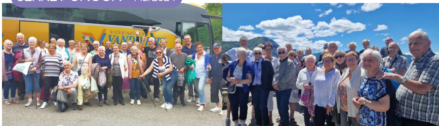
SERRE PONCON - Mai 2024

Programme identique pour 2025 avec les goûters, les lotos, les repas associatifs et les repas dansants, une semaine de vacances sur la Costa de Almeria en Espagne en mai, 3 jours à Paris en juillet (Paradis Latin, Musée Grévin, bateau mouche, Montmartre...) et un week-end en septembre au Zoo de Pairi Daiza à Brugelette en Belgique*.