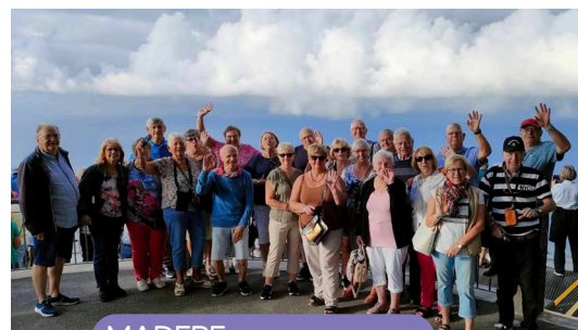
MADERE - Septembre 2024