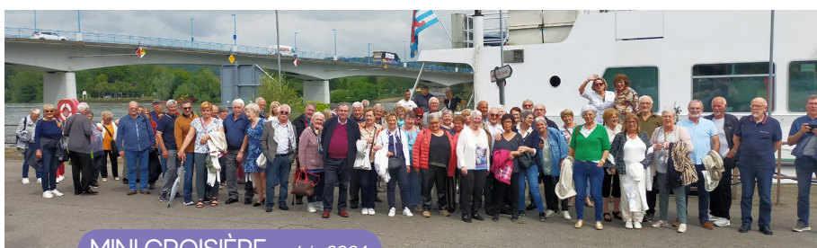
MINI CROISIÈRE - Juin 2024